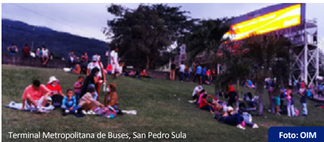
Terminal Metropolitana de Buses, San Pedro Sula