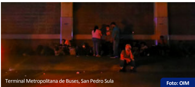
Terminal Metropolitana de Buses, San Pedro Sula