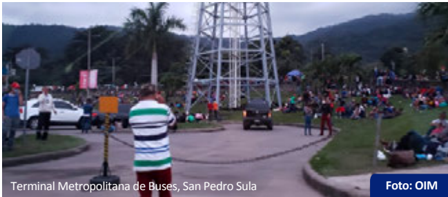
Terminal Metropolitana de Buses, San Pedro Sula